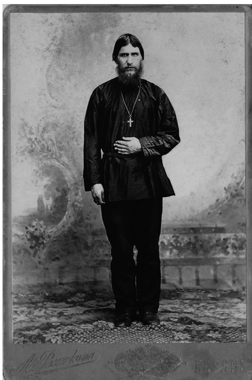
Г. Распутин в фотоателье А. Вяткиной. Казань, 1907

Прошло более ста лет со дня гибели Григория Распутина – одной из самых противоречивых фигур в истории России. Исследователи обращаются к его пророчествам. Что бы ни говорили современники о Тобольском Старце, главное предсказание сбылось вскоре после его смерти: «Пока я жив, с вами всеми и с династией ничего не случится. Не будет меня – не станет и вас». Династия Романовых продержалась всего два с половиной месяца после его убийства.