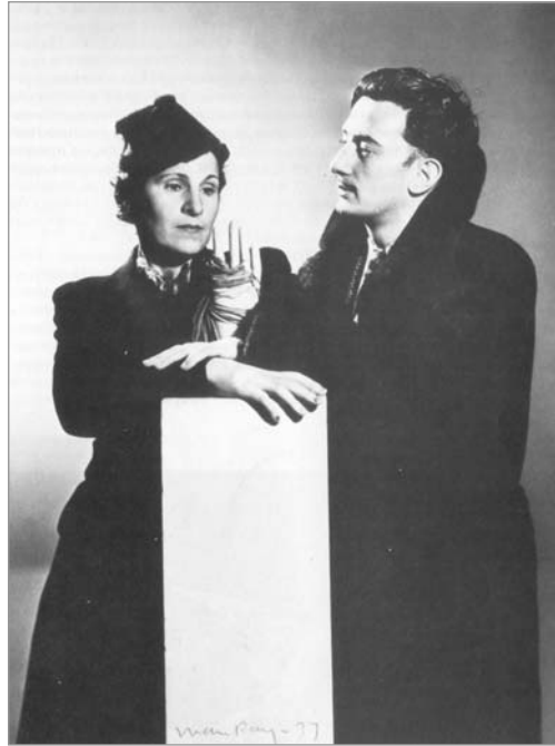
Гала и Дали в Париже. 1937

Мифотворчество – вторая натура Гала Дали. При рождении девочке дали имя Елена, домашние звали её Галой. Мать (писавшая сказки) называла принцессой на горошине. Гала осуществила это прозвище в своей фантазмагорической сказке, соединив образ