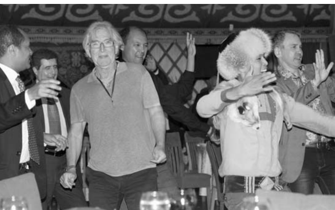
Когда танцует киргиз, и другим невозможно удержаться